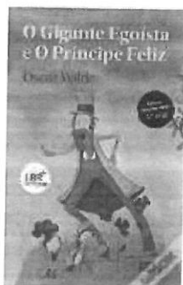
O Gigante Egoísta e o Príncipe Feliz Oscar Wilde