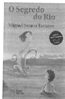
O Segredo do Rio Miguel Sousa Tavares